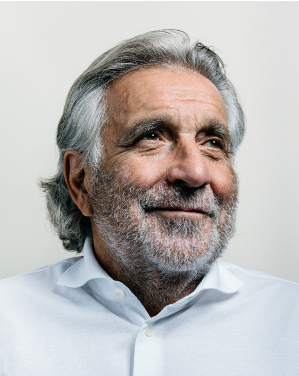
Bernd Gersdorff, 11 Freunde